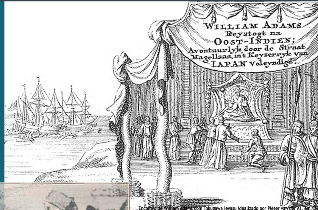
Encontro de William Adams com Tokugawa Ieyasu idealizado por Pieter van der Aa, em 1709